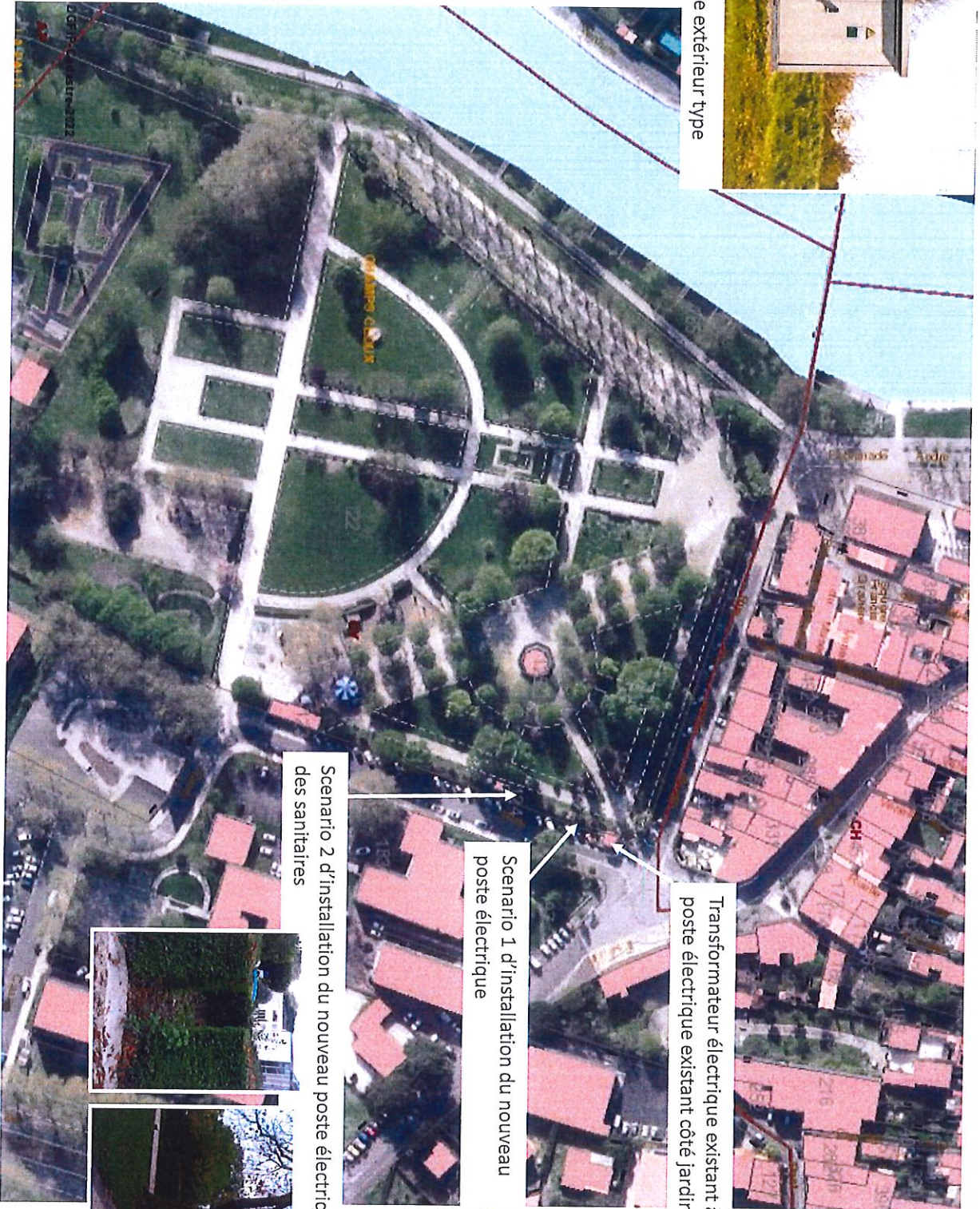
Transformateur électrique existant à l'extérieur du jardin + poste électrique existant côté jardin