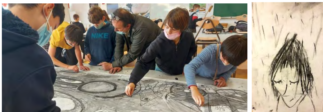
Séances d'ateliers Dessine-moi un monde