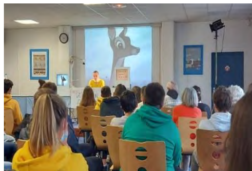
Mon bras , cie Studio Monstre