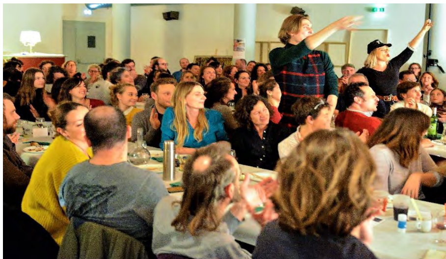
Le dernier Banquet au Centre social Boiffiers Bellevue

puisque toutes les places ont été vendues en quelques jours et nous avons constaté avec grand plaisir le décloisonnement des publics entre les abonnés du Gallia et ceux et celles qui ne fréquentent que trop rarement le théâtre. Cela a été une aventure humaine et artistique extrêmement forte.