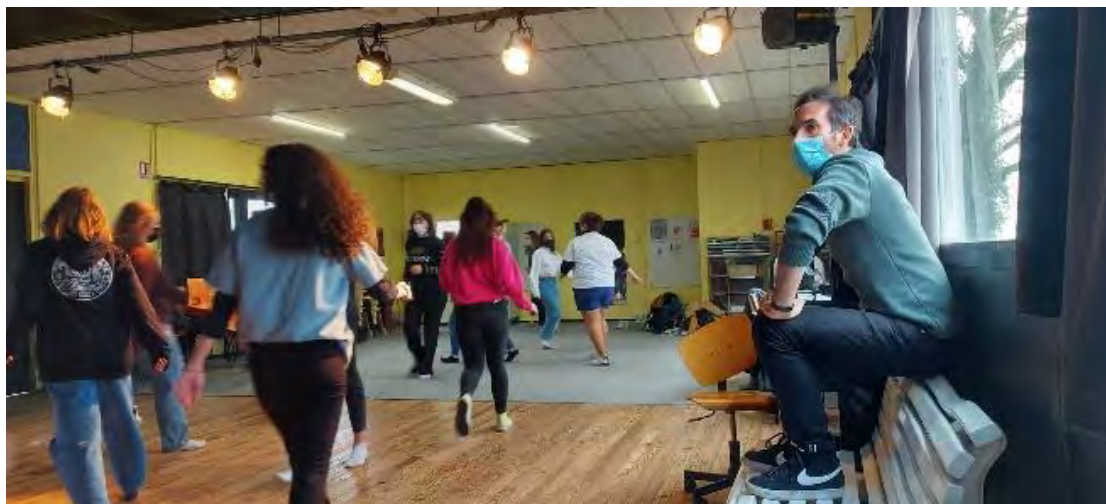
Masterclass avec le collectif OS'O

Des ateliers d'écriture ont aussi été menés avec la complicité des auteurs du Collectif Traverse lors de la création de Pavillon Noir autour de la thématique de la piraterie. Ils ont également participé à plusieurs séances de répétitions. Portés par des équipes éducatives pédagogiques dynamiques et engagées, les projets ont pu se construire sur le long terme rendant la continuité dans la transmission possible et favorisant une relation privilégiée entre les élèves et les comédiens.