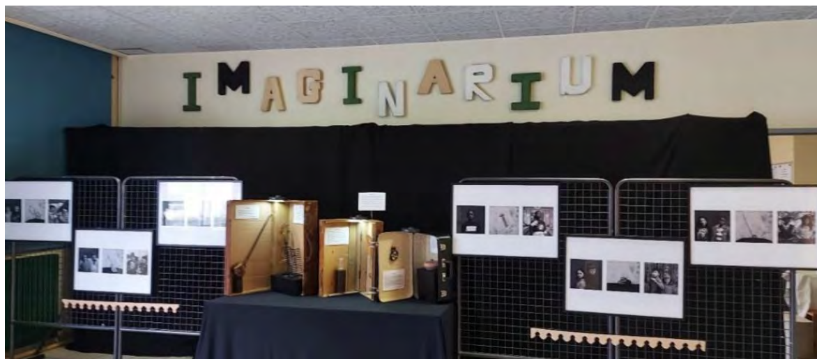
Exposition Imaginarium menée avec la compagnie du Dagor et les enfants du Centre Social Boiffiers-Bellevue

Un groupe de bénévoles a accueilli la compagnie du Dagor pendant ses trois semaines de résidence, avec grande générosité, notamment en préparant à manger tous les midis (travail préparatif en amont, rotation des équipes bénévoles pour préparer les repas). L'occasion de très belles rencontres !