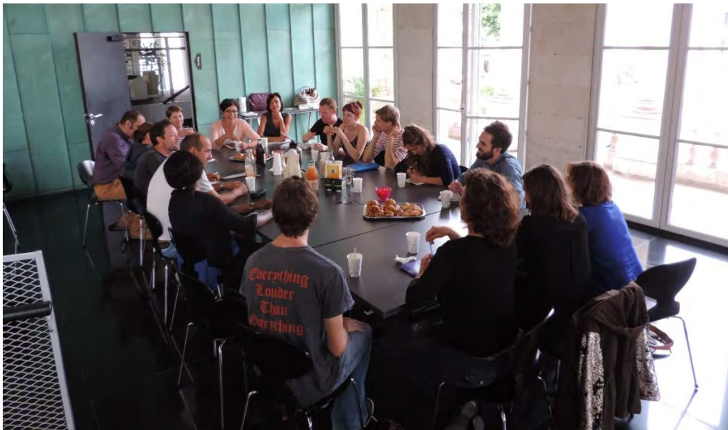
Réunion de travail avec le collectif OS'O et l'équipe du Gallia

Ainsi, les années suivantes nous avons accompagné en diffusion et coproduction : Mon Prof est un Troll en décentralisation dans les Centres sociaux de Saintes et dans différents endroits de la ville ; Pavillon Noir en janvier 2018 avec une reprise l'automne suivant ; Faites l'Amour marathon d'écriture sous la forme d'un projet participatif hors les murs au Jardin Public de Saintes ; Le dernier Banquet en 2019 au Centre Social Boiffiers Bellevue ; X en décembre 2021 et Qui a cru Kenneth Arnold ? , spectacle coproduit en 2020 (accueilli en 2023).