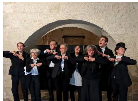
Passe-moi le texte