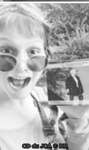
CD du JOA