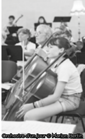
Orchestre d'un jour