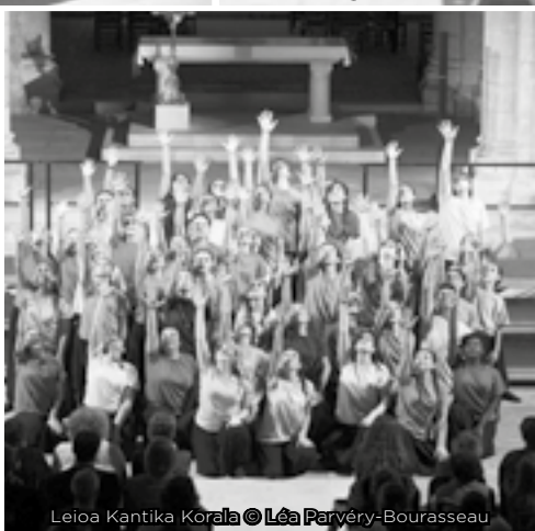
Leioa Kantika Korala

MERCI DE NOUS AVOIR SOUTENUS EN 2019! MEILLEURS VŒUX 2020