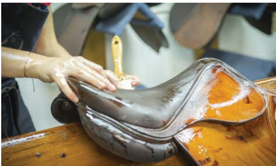
L'entreprise saintaise exporte 75% de sa production.