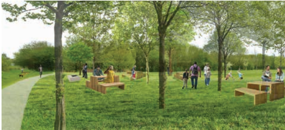
Des activités de détente, de contemplation et de découverte de la nature.

► Le projet de base familiale et écologique sur une parcelle de 5 ha du site de la Palu se précise. La première phase de travaux est prévue à la rentrée.