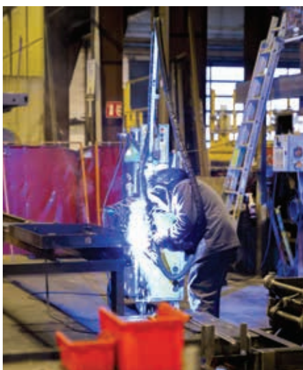
Cefam-Atlas est aujourd'hui le premier constructeur français dans son domaine.

▶ Cefam-Atlas (Compagnie Européenne de Fabrication d'Appareils de Manutention), a été créée en 1968. Elle est installée à Saintes dans la zone d'activités de l'Ormeau-de-Pied, sur un site couvert de 12 000