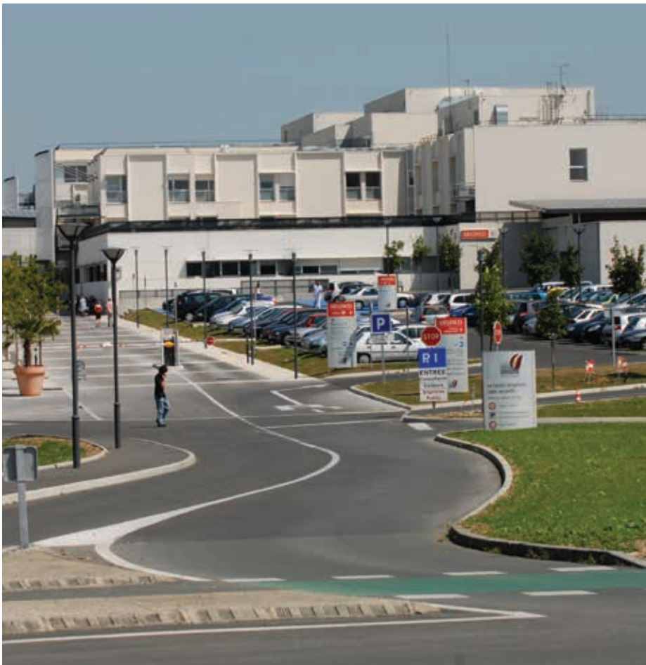
Le CHS couvre une grande moitié Sud et Est du département.

► Hôpital de recours du département avec celui de La Rochelle, le CHS a remplacé l'ancien hôpital Saint-Louis, désaffecté en 2007, et est au centre d'une cité hospitalière regroupant huit pôles techniques et médico-techniques, deux hôpitaux de jour, une unité de psychiatrie adulte et de psychiatrie infanto-juvénile, deux instituts de formation et une maison d'accueil pour les familles des personnes hospitalisées. Le CHS a pour mission de proposer une large gamme de soins à un bassin de population couvrant une grande moitié Sud et Est du département, depuis Saint-Jean-d'Angély et Jonzac, en passant par Royan et Pons. Le Centre Hospitalier de Saintonge propose des services d'urgence 24h/24 et 7j/7, de cardiologie (Unité de soins intensifs de cardiologie), chirurgie digestive, chirurgie plastique réparatrice et maxillo-faciale, oncologie, urologie, neurologie, psychiatrie et hépato-gastro-entérologie. Il compte 869 lits et emploie 2 154 personnes réparties à travers 110 métiers différents. ►