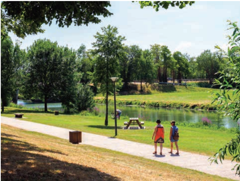
Les tables de pique-nique très appréciées des usagers.