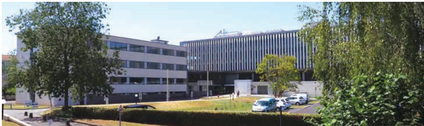
La Cité entrepreneuriale, boulevard Guillet-Maillet.

► En matière d'emploi, il n'y a pas de fatalité. Il faut dans les situations difficiles, savoir rebondir et restructurer pour transformer les menaces en opportunités.