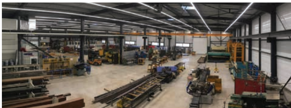
La surface totale des ateliers s'étend désormais sur 3 000 m 2 .

► Spécialiste de la réalisation d'équipements et de process industriels complets depuis sa création en 1981, ArTechman a développé des solutions de manutention automatisée adaptées aux différents secteurs industriels. « Nos équipes d'ingénieurs et techniciens expérimentés nous permettent d'être force de proposition et de répondre à l'ensemble des demandes de nos futurs clients, tout en respectant notre politique de suivi : installation, réparation, maintenance », indique son dirigeant.