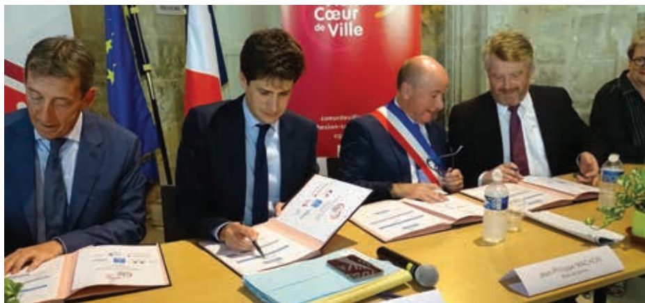
Le ministre de la Ville et du logement, Julien Denormandie, aux côtés du maire de Saintes, le 12 juillet à Saintes pour signer l'Opération de Revitalisation de Territoire (ORT), prolongement de l'Action Cœur de Ville.

► Saintes fait partie des 222 communes bénéficiaires du plan national «Action Cœur de Ville» , lancé par l'État en fin d'année 2017. Le 25 septembre 2018, la Ville, la CDA, l'État et les partenaires financeurs ont signé la convention Action Cœur de Ville qui vise à fédérer les compétences, les moyens humains et financiers pour le développement et la revitalisation du centre-ville de Saintes dans les prochaines années .