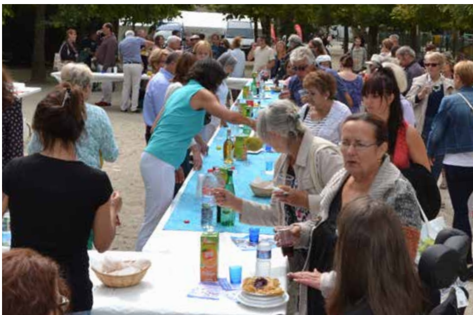
Chaque année à la rentrée, les familles saintaises sont invitées à partager le verre de l'amitié, servi par les élus.

► Le grand rendez-vous festif de la rentrée à Saintes va cette année encore rassembler de nombreuses familles saintaises les 7 et 8 septembre prochains au jardin public pour le «Pique-nique Sympatik!», et près de 200 associations au Hall Mendès-France. La cérémonie d'accueil des nouveaux Saintais aura lieu à la mairie.