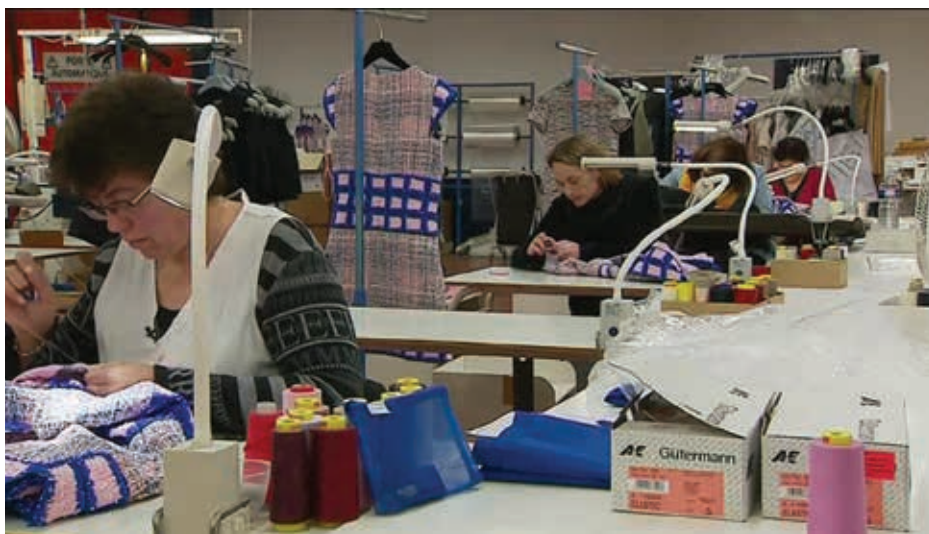
L'entreprise spécialisée dans le haut de gamme souhaite embaucher une dizaine de personnes supplémentaires.

► Fondée en 2005, Amarine Couture travaille pour les maisons de couture les plus prestigieuses. Spécialisée dans le mariage, elle intervient aussi dans le prêt-à-porter féminin haut de gamme : blousons, jupes courtes et longues, jupes-culottes, robes courtes et longues, chemises, vestes, tee-shirts, blazers, blouses, tuniques... L'entreprise saintaise fait valoir un savoir-faire très recherché, voire convoité. Capable de travailler les matières les plus nobles tels que le cuir et la soie mais aussi la laine, les cou-