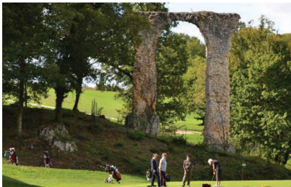
Chaque année ce sont plus de 3 500 pratiquant.e.s qui fréquentent le Golf de Saintes.

► Pleinement lié au patrimoine de la ville, installé près des vestiges de l'aqueduc gallo-romain, le Golf Louis Rouyer-Guillet a été créé en 1953. Son parcours de 18 trous sur 40 hectares de nature au cœur de la Saintonge, allie la technique au plaisir de jouer et permet aux golfeurs d'affronter une variété de difficultés sur le parcours.