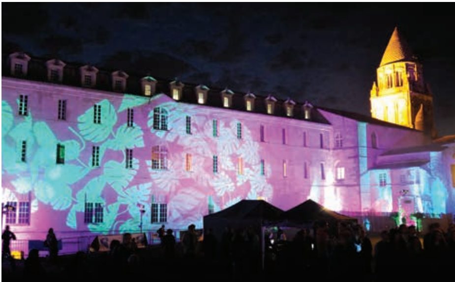
Chaque année le Coconut Music Festival célèbre la fin de l'été en musique, au cœur de l'Abbaye-aux-Dames.

► Du 12 au 15 septembre, le Coconut Music Festival reprend ses quartiers comme chaque année à l'Abbaye-aux-Dames. Mélange des genres, valeurs sûres et nouveautés composent la programmation de cette 7 e édition, avec des groupes comme Hamza, 13 Block, Altin Gün ou encore Prince Waly et Rozi Plain.