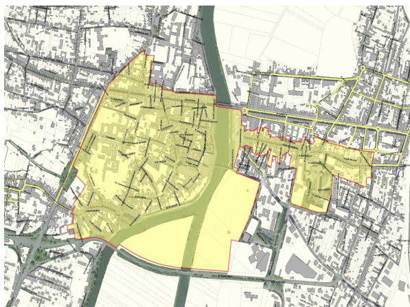
Ancien secteur sauvegardé