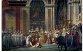
Jacques Louis David