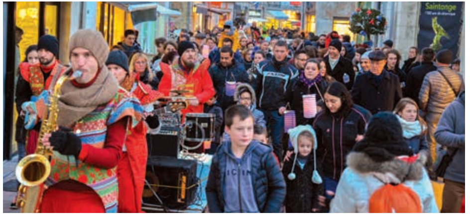
Déambulation en centre-ville pour la fête de lumières des Noëls Blancs.

De l'aménagement de la voirie à la requalification urbaine, en passant par les animations, le développement touristique, la valorisation du patrimoine... les actions sont nombreuses. Par exemple, la reconversion du site Saint-Louis , situé à quelques minutes à pied du centre ancien, le destine à devenir un espace de vie incontournable. La reconquête des friches industrielles est aussi une priorité pour la Ville. La création d'une base de loisirs familiale à la Palu s'inscrit aussi dans ces projets de revitalisation du centre-ville. Le pôle innovation , situé dans la cité entrepreneuriale au cœur