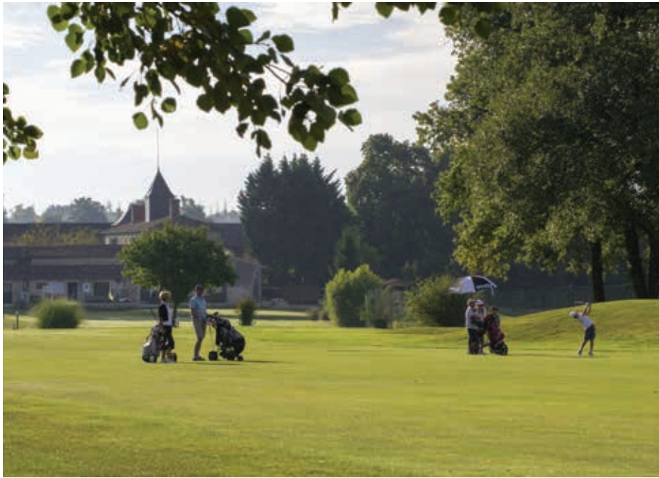
L'un des moments forts reste le Trophée Blues Passion, chaque année au mois de juin.

► Reconnu au niveau national, le golf de Saintes Louis-Rouyer-Guillet, multiplie les projets, s'investit dans les compétitions et poursuit sa politique de développement durable et d'accès au golf pour tous.