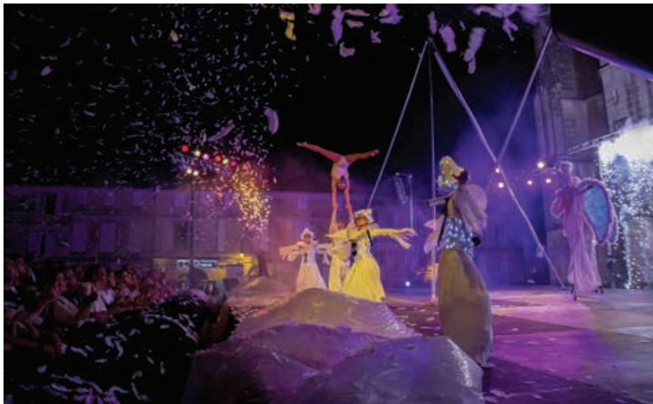
L'église Saint-Eutrope, composante du chemin de Saint-Jacques-de-Compostelle, fêtée sous les étoiles en 2016.

► Saintes, première capitale gallo-romaine avec ses édifices préservés, propose bien d'autres trésors à ses visiteurs. La saison 2018 s'annonce captivante avec une offre touristique renouvelée tant dans son contenu que dans sa forme.