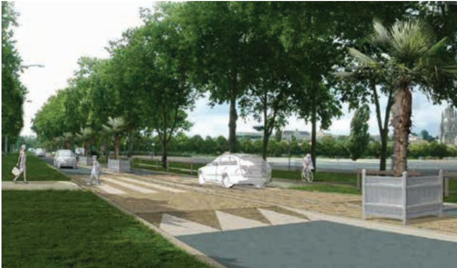
Dans un milieu naturel riche, avec des enjeux environnementaux forts, le chantier a fait l'objet d'une étude d'incidences.

► L'aménagement de l'avenue de Saintonge entre dans une réflexion paysagère et sécuritaire accolée à une opération d'entretien des deux ponts. Les travaux débutent mi-juin jusqu'au 28 septembre 2018.