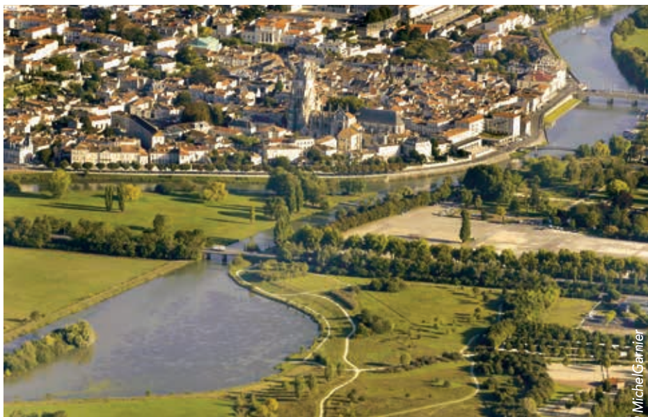
Saintes va bénéficier du programme «Action cœur de ville».

► Saintes vient d'être inscrite au plan national «Action cœur de ville», parmi les 222 villes françaises éligibles. Au total, 5 milliards d'euros vont être débloqués par l'Etat sur cinq ans.