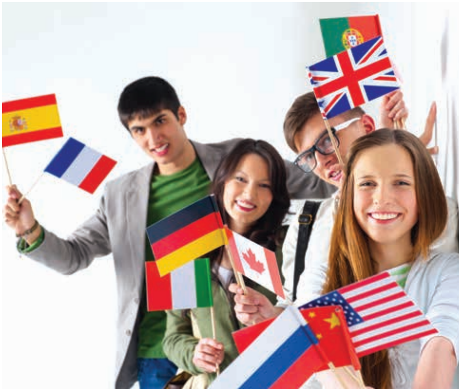
Les jeunes étudiants vivent en immersion dans une famille d'accueil pendant toute la durée de leur séjour.

► D'Allemagne, du Brésil, du Mexique ou d'ailleurs, de jeunes étrangers viennent en France pour apprendre le français et découvrir notre culture.