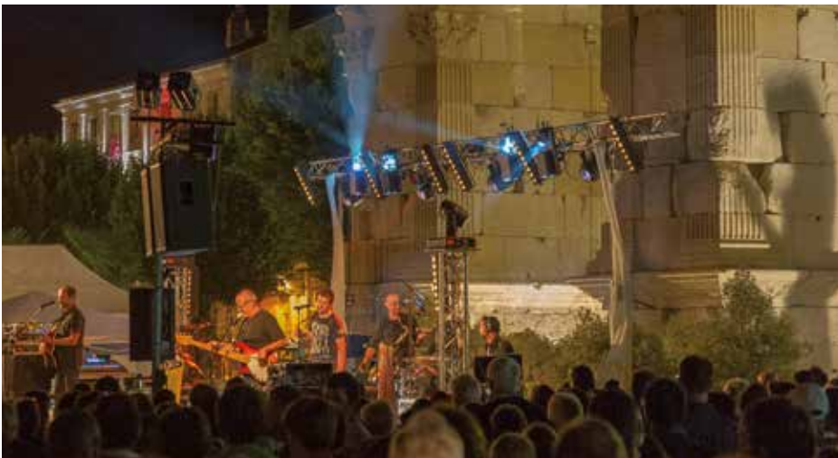
Un bal populaire est organisé à partir de 23 h 30, Place Bassompierre.

► La Municipalité de Saintes vous réserve un programme riche et international, pour honorer comme il se doit la grande fête du 14 juillet. Défilés, groupes folkloriques, concerts, bals populaire et traditionnel, feu pyromélo-dique... Et de nombreuses autres surprises à découvrir le jour J !