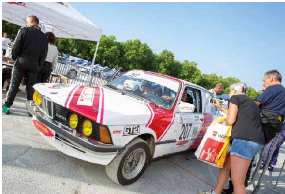
Le rallye attire chaque année un public nombreux.

► Les bolides du rallye de Saintonge vont lancer leurs chevaux sur les routes vallonnées de Bussac au Douhet et plus sinueuses de Juicq à La Fredière. Un grand rendez-vous du sport automobile en Charente-Maritime orchestré par l'ASA Saintonge.