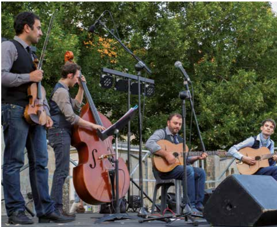
Musique et convivialité au programme des Jeudis de Saint-Louis cet été.

► Événement très apprécié des Saintais, les Jeudis de Saint-Louis ont animé l'esplanade de l'ancien hôpital mais cet été, le rendez-vous est donné au jardin public. L'ambiance y sera chaleureuse, la nourriture goûteuse et la musique de qualité. Et en plus c'est gratuit !