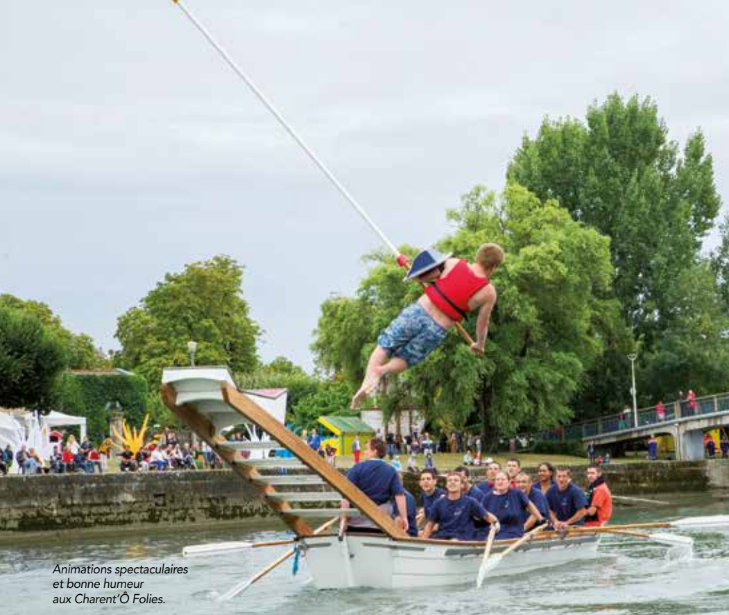
Animations spectaculaires et bonne humeur aux Charent'Ô Folies.