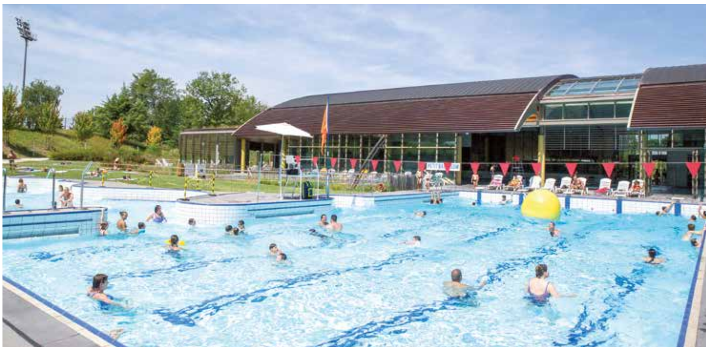
Les bassins extérieurs d'Aquarelle.

► Aquarelle a été l'objet d'une enquête de satisfaction réalisée en février. Sur 209 réponses recueillies, 203 personnes avouent recommander cet équipement de la CDA à leur entourage.