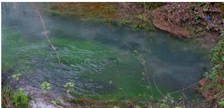
La résurgence de Lucérat.

Un château d'eau en pierre est alors construit à la jonction du cours Genet et de la rue Bourignon, qui est alors le point le plus haut de l'agglomération (31 m) et une usine élévatoire à vapeur est construite à l'emplacement actuel du parking de l'Aubarrée.