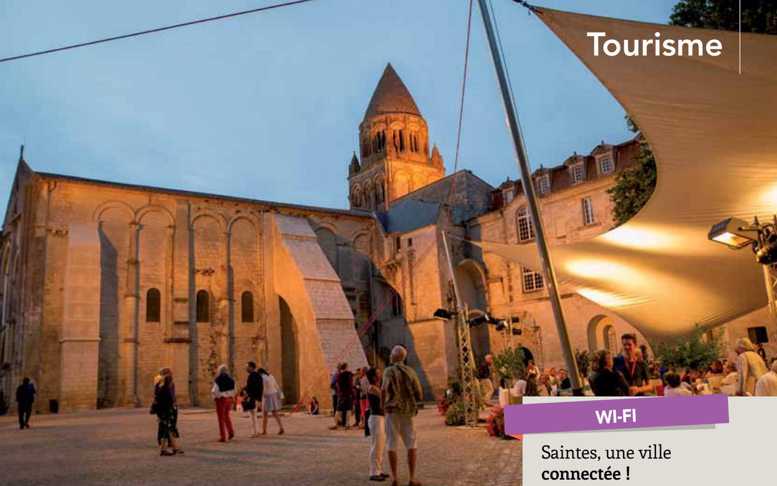
Le nouveau parcours baptisé "Musicaventure" utilise un son 3D unique en France.