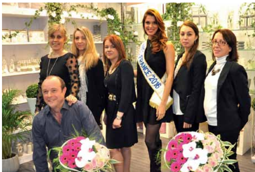
Toute l'équipe de Rapid' Flore à Saintes aux côtés de Iris Mittenaere, Miss France 2016. (Mélanie Beauchaud est la seconde à droite).