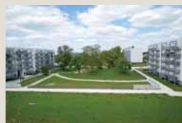
▲ Le projet achevé