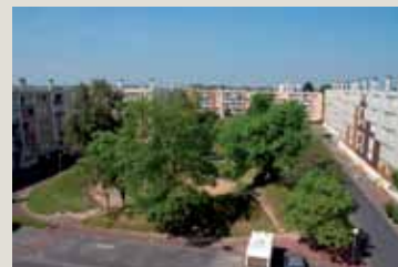
▲ Le quartier avant lancement du PRU

Les Boiffiers : avant, pendant et après travaux