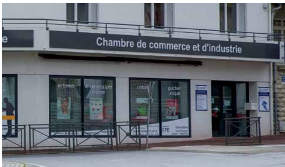
La CCI constate une baisse de 9,7 % de créations d'entreprises entre 2014 et 2015.

► L'antenne saintaise de la CCI Rochefort-Saintes a dévoilé son rapport d'activité pour l'année 2015. Le constat est amer avec moins d'entreprises créées.