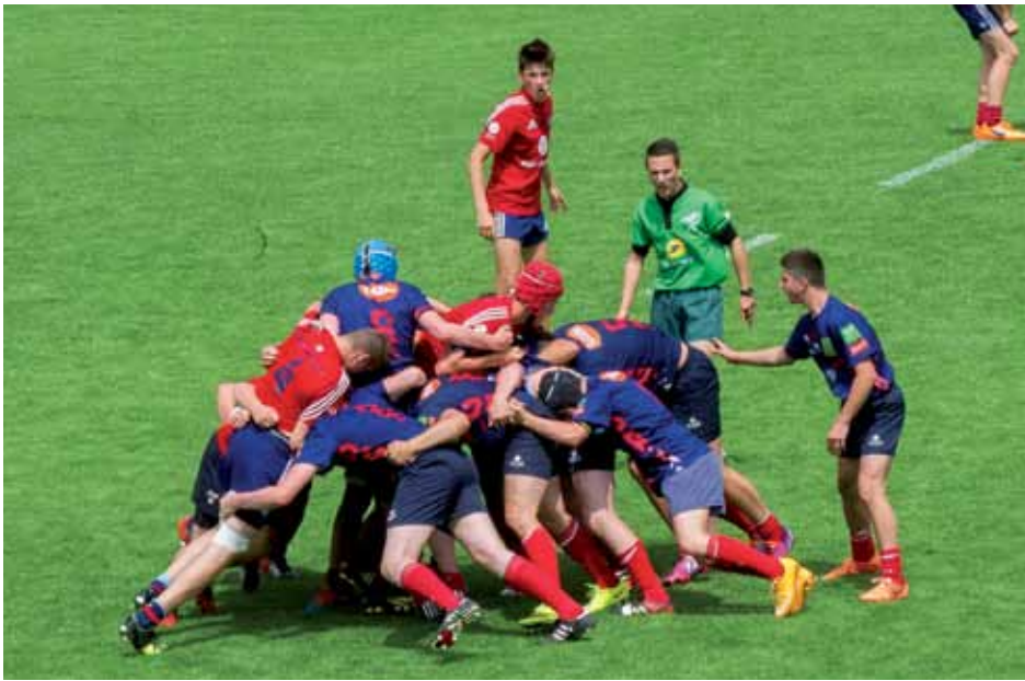
L'élite nationale des moins de 14 ans sera à Saintes les 11 et 12 juin.

► Moment fort de la vie rugbyistique saintaise, le Tournoi des Arènes réunit chaque année le haut niveau national des moins de 14 ans. La 3 e édition se déroule les 11 et 12 juin à Yvon-Chevalier.