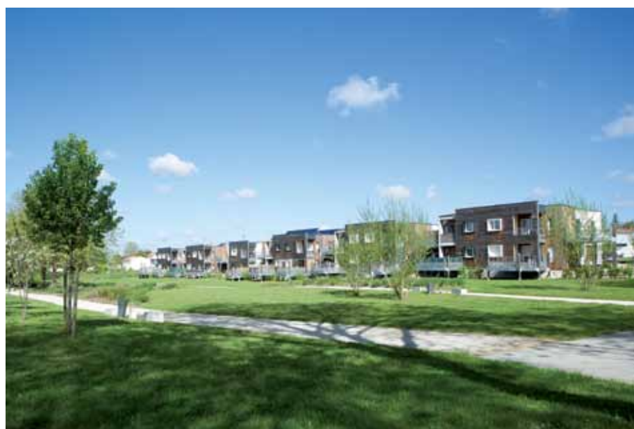
▲ Le quartier du Vallon

Les objectifs ont été largement atteints avec plus de 75 000 heures réalisées, soit 9 emplois temps plein par mois pendant près de cinq ans, occupés par les habitants des quartiers PRU à 94 %. Des emplois pérennes à la sortie du dispositif dans 62 % des cas.