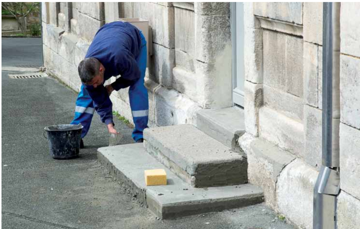
Les personnels municipaux sont chaque jour sur le pont pour l'entretien et les réparations dans les bâtiments scolaires.