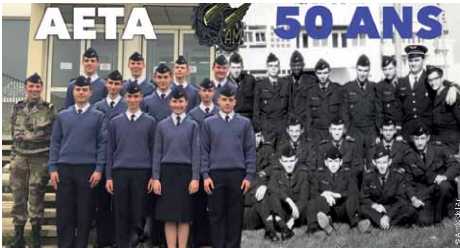
L'AETA fête ses 50 ans cette année.

► L'association des anciens élèves de l'école d'enseignement technique de l'armée de l'Air, créée en 1966, célèbre son cinquantenaire.