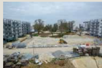
▲ Pendant les travaux de réaménagement de l'espace public