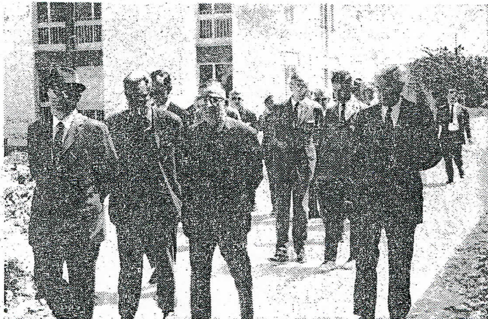
Les personnalités pendant la visite.